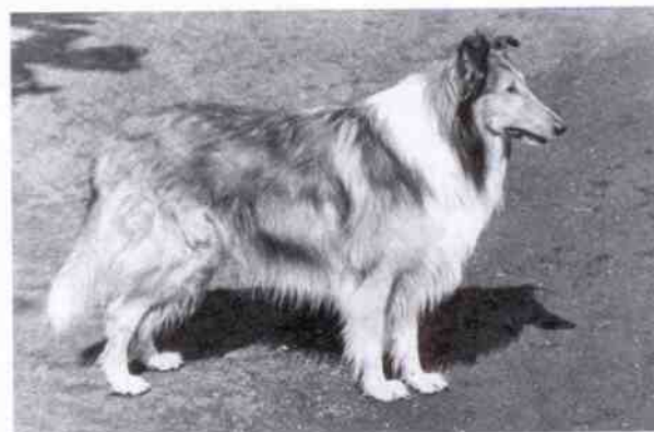
Чемпион породы, всесоюзный победитель, многократный победитель московских выставок ФРАНТ, рожд. 1962 г.

ва колли уникальна по своей форме, характерные только для колли миндалевидные глаза косога разреза в сочетании с полустоячими, изящными ушами придают собаке выражение, которого нет ни в одной другой породе. Плавные движения, манеры, собака во всем излучает истинную интеллигентность. Колли – это аристократ в мире собак.