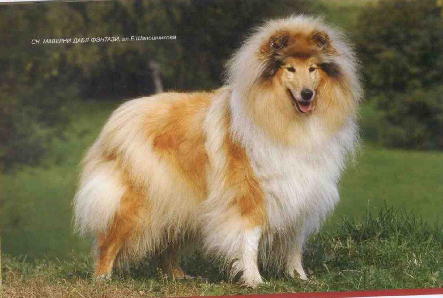
СН. МАВЕРНИ ДАБЛ ФЭНТАЗИ, вл. Е. Шапошникова

спины, но тем не менее общее впечатление – нарушается. Другая распространенная проблема – неоднозначное восприятие идеала породы разными заводчиками (а вместе с ними – экспертами). Действующий ныне